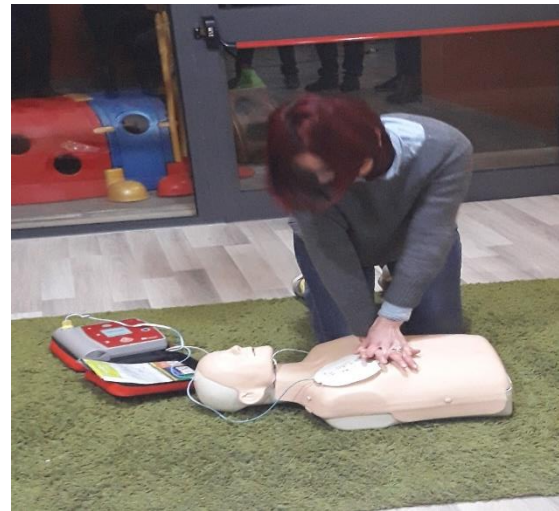
Corso teorico-pratico di BLSD (PRIMO SOCCORSO)

La Sezione primavera Disneyland ha provveduto ad aggiornare il DVR nel quale sono presenti le indicazioni da applicare, in virtù della situazione emergenziale dovuta al COVID-19 a tutte le componenti umane che regolano l'attività della struttura, minori, famiglie e personale in servizio.